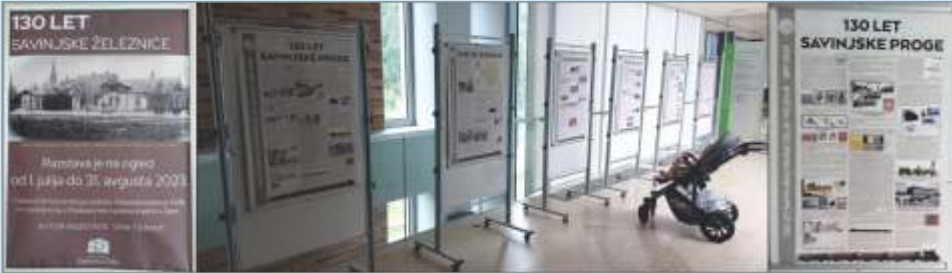
Utrinek z naše razstave v Knjižnici Celje.