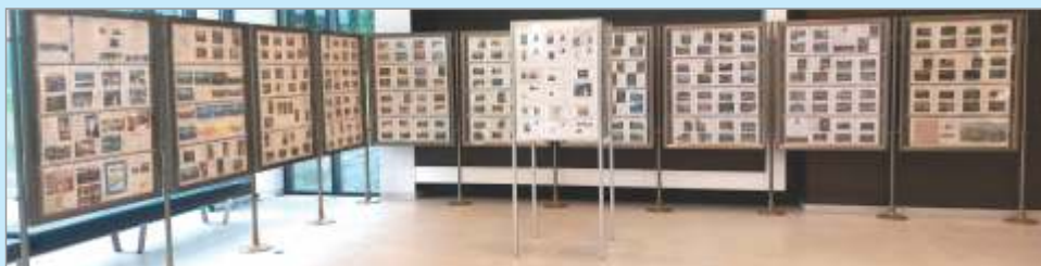
Pogled na prvo polovico razstave